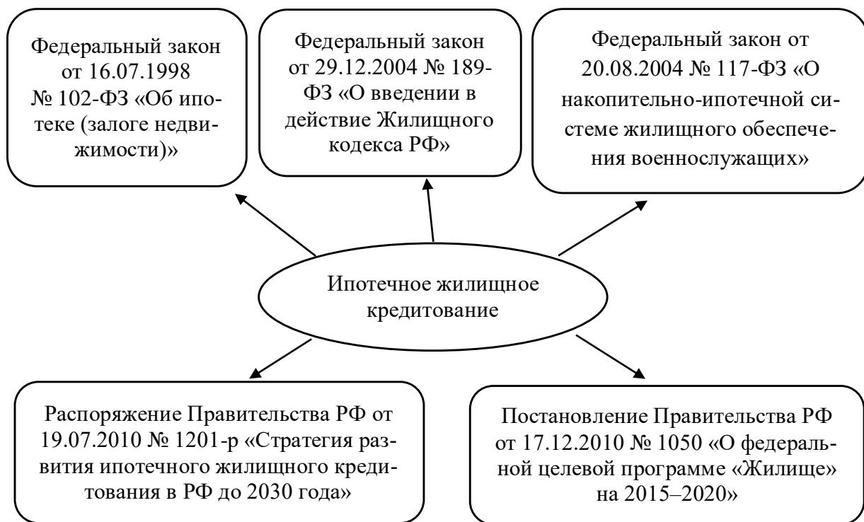
Рис. 1.2. Законодательная и нормативная база регулирования ИЖК*